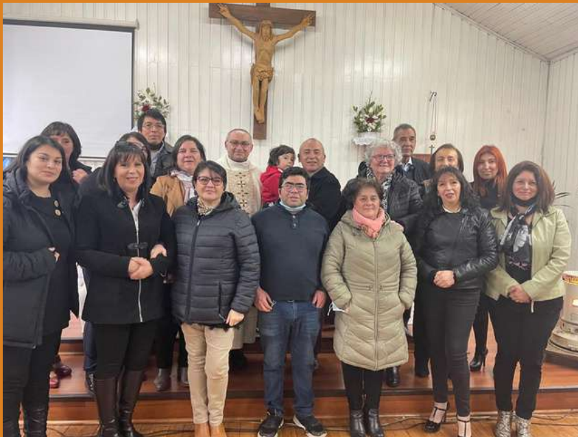
Parroquia SANTO TOMÁS DE VILLANUEVA

La Ceb Asunción de la Virgen María, cumplió un nuevo aniversario, el pasado 15 de agosto, festejó 58 años. En la celebración se efectuó un reconocimiento a un grupo de agentes pastorales por su trayectoria y cariño hacia la iglesia. Además en la ceremonia se revistieron dos nuevos acólitos.