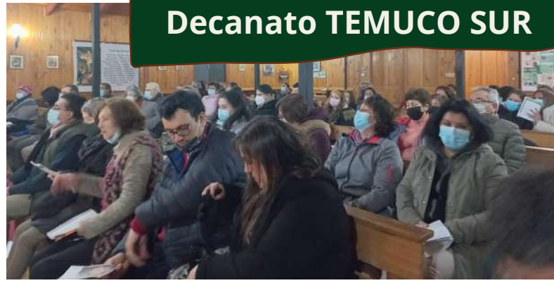
Santa Misa en la Ceb San Alberto Hurtado de la parroquia SANTIAGO APÓSTOL de la ciudad de Temuco, para la celebración del día de la solidaridad.