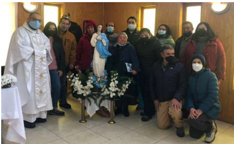
Solemnidad de la ASUNCIÓN DE LA VIRGEN en el sector cordillerano de Lonquimay