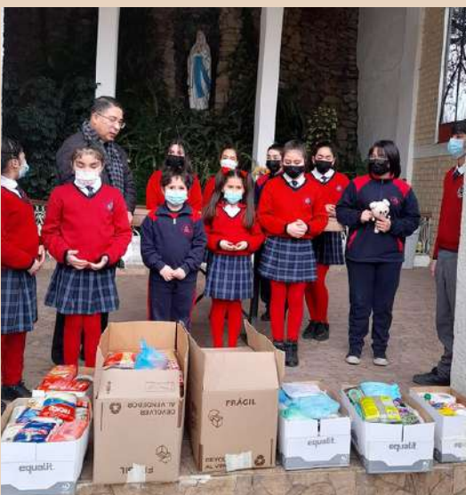
En el mes de la solidaridad, niños del colegio el Rosario, entregaron sus aportes que van en directo beneficio de muchas familias que lo necesitan.