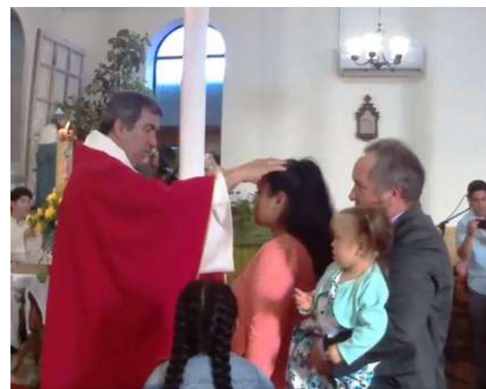
En el día de la Epifanía del Señor, jóvenes celebraron su Confirmación, en la parroquia Los Santos Ángeles Custodios de Los Sauces.