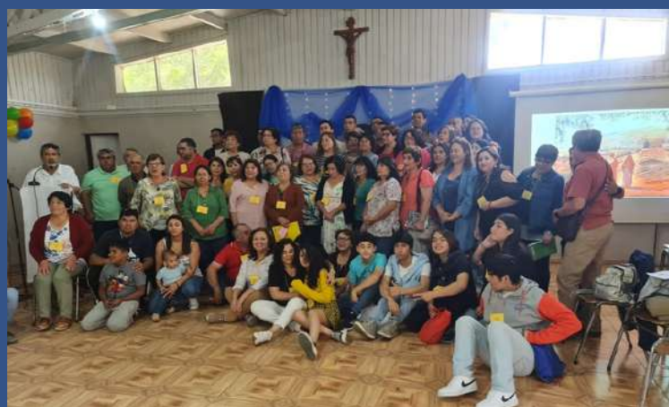
El 15 de enero, la comunidad parroquial de San Juan Bautista de Huequén, realizó su Asamblea de Planificación parroquial 2023.