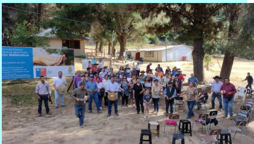
"Encuentro de Comunidades Rurales" en sector Cerro Negro.