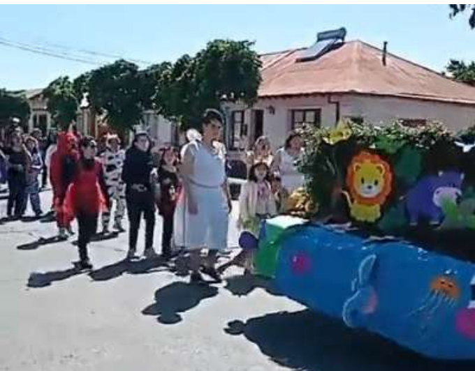
Caravana en honor a Cristo Rey del Universo realizó la comunidad parroquial de Cristo Rey de la comuna de Angol.