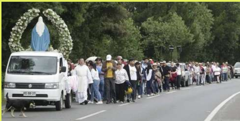
Celebración de la Solemnidad de la Inmaculada Concepción, donde cientos de fieles peregrinaron para acompañar a la Santísima Virgen María.