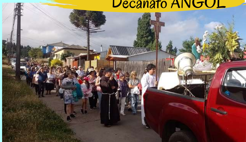
Con mucha alegría y devoción, la comunidad parroquial de SAN BUENAVENTURA de Angol, celebró a la Santísima Virgen María el 8 de diciembre.