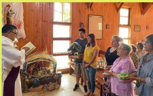
Celebración del cuarto Domingo de Adviento en el sector Tijeral