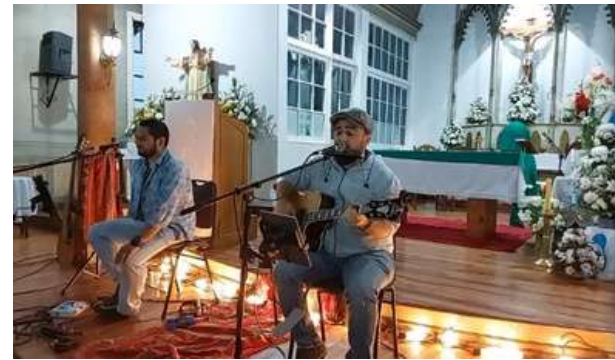
Presentación del grupo musical Envía2

La Parroquia NUESTRA SEÑORA DEL CARMEN de Chol Chol se hizo presente en la Asamblea Eclesial Diocesano de Pastoral en el marco del Sínodo de la Sinodalidad.