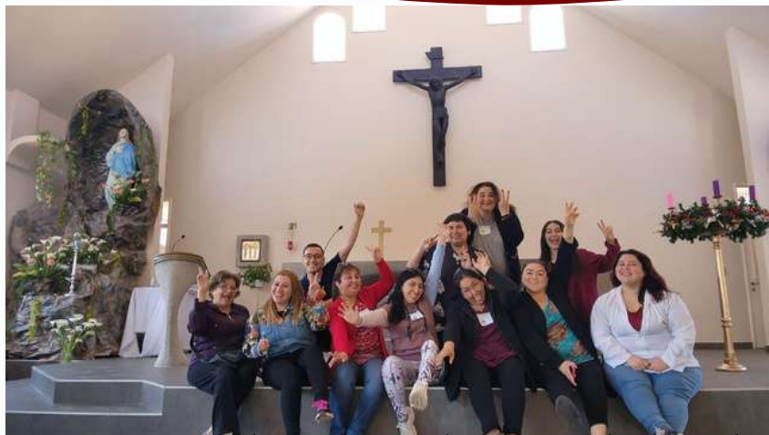
Pastoral de Asesores de Pastoral Juvenil