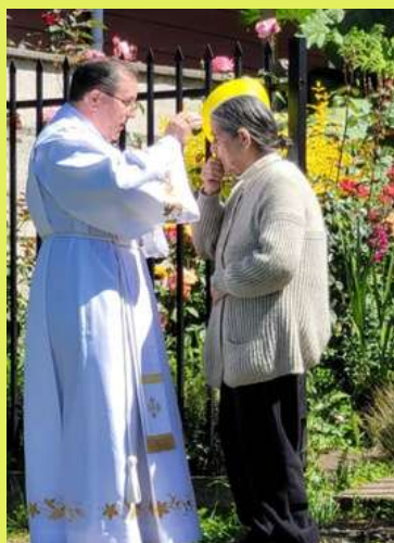
La comunidad parroquial en la celebración de Cristo Rey. Solemnidad de Nuestro Señor Jesucristo, Rey del Universo.