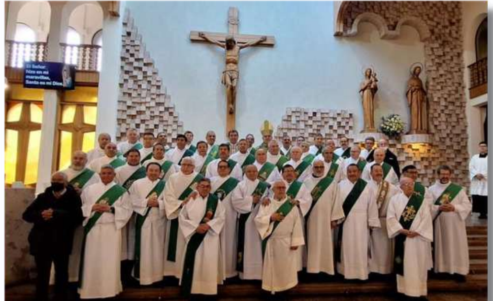
Santa Misa por día de los diáconos Obispo de Temuco "Hermanos diáconos, Gracias por su amor a la Iglesia"

En la Santa Misa en el Templo Catedral, expresó su gratitud al Señor, por el servicio que hacen a Él, a su Iglesia y siempre teniendo el recuerdo de San Lorenzo, resaltando el amor por la Iglesia "Quiero recordar dos características de la entrega, de aquello que movió siempre a Lorenzo y que lo lleva hasta el martirio y que es su amor a la Iglesia y también el amor a los pobres, que tiene que estar siempre presente en el Ministerio Diaconal y ése es el servicio también a la Iglesia".