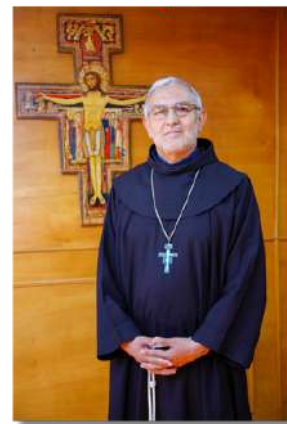
+ JORGE CONCHA CAYUQUEO Obispo Diócesis San José de Temuco

E n el Vaticano, entre el 4 y 29 de octubre, se ha celebrado la XVI Asamblea general Ordinaria del Sínodo de los Obispos, sobre el tema “Por una Iglesia sinodal: comunión, participación y misión. Ha sido la primera parte, que tendrá continuidad en octubre de 2024. Han sido 26 días, donde 464 participantes han reflexionado y cuyos frutos han sido dos documentos: la Carta de la Asamblea al Pueblo de Dios y el Documento de Síntesis, los cuales deberán ser reflexionados en este tiempo intermedio.