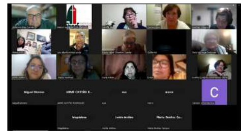
Decanato de Angol