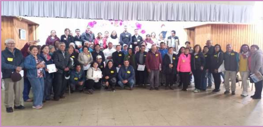
Encuentro de Animadores en el Decanato de Imperial

Una amena y fraternal jornada se dio lugar el sábado 25 de noviembre, en las dependencias de la parroquia San Miguel Arcángel de Nueva Imperial, lugar que acogió a 53 hermanos animadores de las comunidades eclesiales de base urbanas y rurales pertenecientes al Decanato de Imperial.