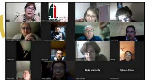
Decanato de Victoria