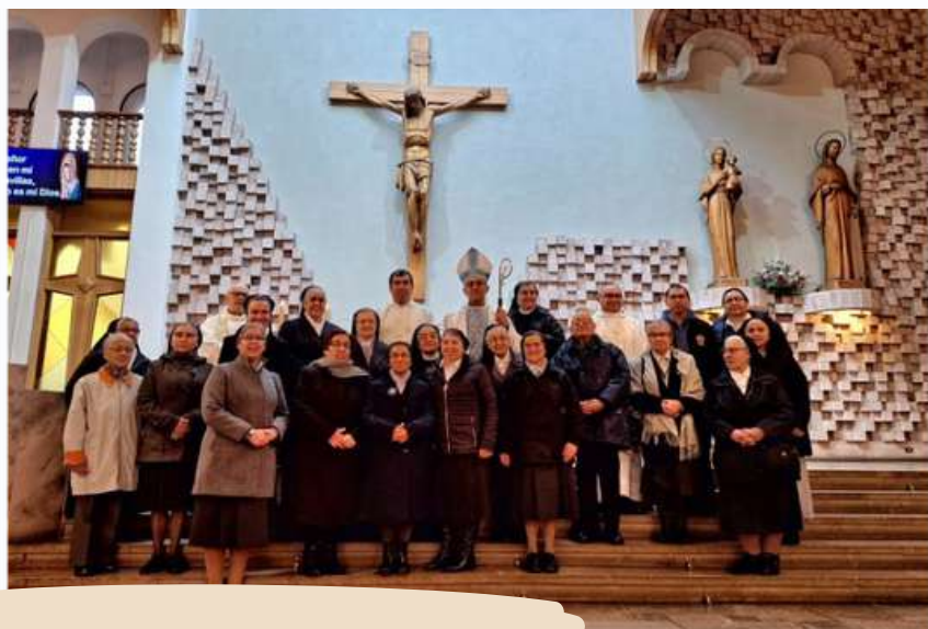
Obispo de Temuco preside celebración de la Vida Consagrada

En su homilía, el obispo les señaló ser Sal y Luz en la vida de sus comunidades, como Jesús pide a sus discípulos, " Queridos hermanos y hermanas, gracias por su servicio en nuestra Diócesis y para el bien de todo el mundo, que siga siendo gozo de todo este pueblo, principalmente con la alabanza y con la oración, pero esto mismo lo pedimos no solamente para la vida religiosa sino que para todos quienes somos discípulos del Señor Jesús". Al respecto, ahondó sus palabras al decir, "Lo único que hace la vida religiosa es tratar esforzarse, empeñarse de vivir con más radicalidad este llamado que es para todos, todos somos bautizados, el llamado es a ser sal, a ser luz, a dar testimonio".