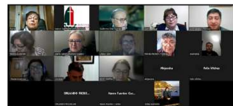
Decanato Tco. Norte