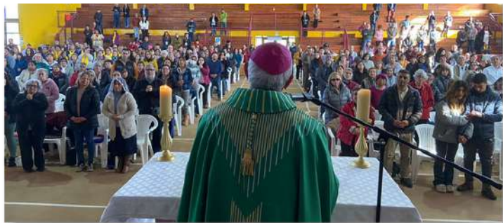
Primer Congreso de Sanación y Liberación en Labranza - Temuco

EL sábado 07 de octubre, se realizó el primer congreso de sanación y liberación organizado por el equipo de evangelización Con Jesús a Bordo, jornada que se llevó a cabo en el Gimnasio Municipal de Labranza y que congregó a más de 400 personas, provenientes de diversas regiones de Chile, como Iquique, Santiago, Monte Patria y de varias comunas de la Diócesis San José de Temuco.