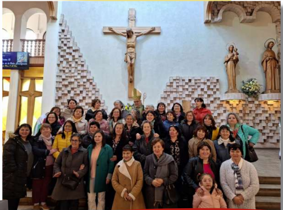
Iglesia diocesana agradece a nuestros queridos diáconos