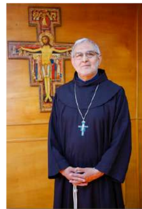
+ JORGE CONCHA CAYUQUEO, OFM Obispo Diócesis San José de Temuco