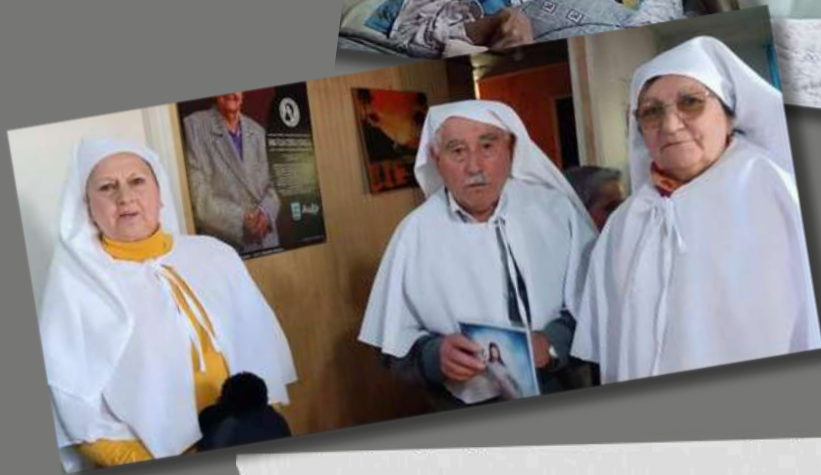
Fiesta de Cuasimodo en Victoria, Lonquimay y Labranza