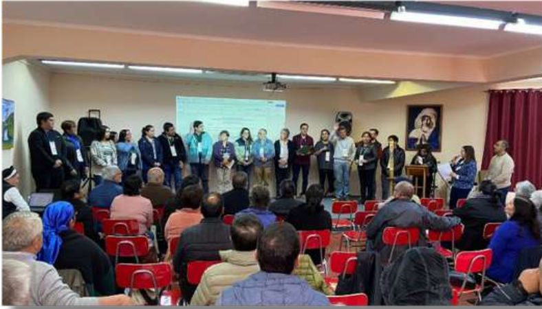
Informe sinodal y revisión de las OOPP